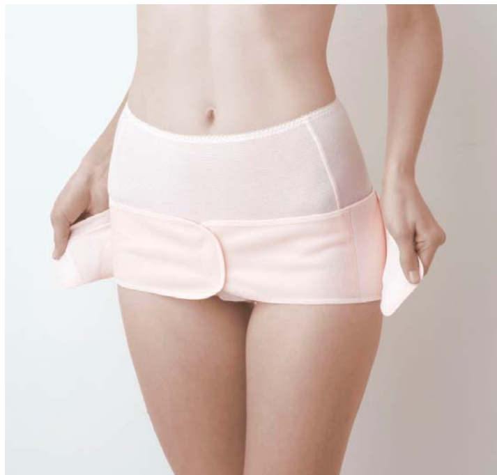
写真の商品 『産後骨盤ベルト』 MGQ・405（ピンク）

全国の百貨店、下着専門店のマタニティ売場、ワコールウェブストアで発売し、15,000 枚の売上（2012 年 3 月～6 月）を目指します。