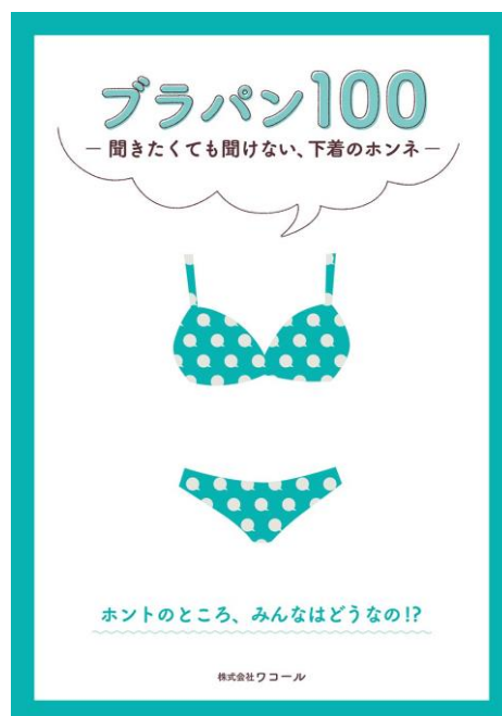
「ブラパン 100－聞きたくても聞けない、下着のホンネー」表紙

（※）ワコールのウェブサービスをより便利にお使いいただくためのメンバー専用ページ（無料）です。 マイワコールの登録メンバーは、2017年2月末で約180万名。