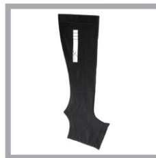
CW-X PARTS Calf&Ankle