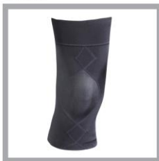
CW-X PARTS Knee Premium