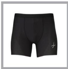
CW-X PARTS Hip Joint Guard