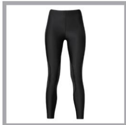
CW-X STYLE FREE® BOTTOM