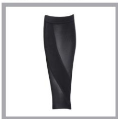
CW-X PARTS Calf Premium