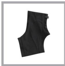
CW-X PARTS Ankle