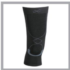
CW-X PARTS Knee Standard