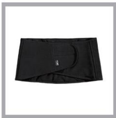
CW-X PARTS Waist