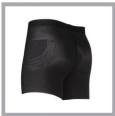
CW-X PARTS Hip Joint Smooth