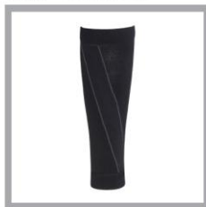
CW-X PARTS Calf Standard