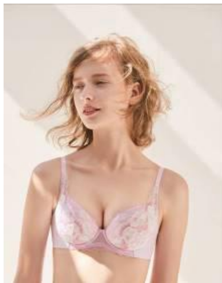
重力に負けない『バストケア Bra』 BRB-404 (カラー: RP)

※「バストケア」とは、からだのサイズを測って自分に合うブラジャーをつけてバストを重力から守ることで。