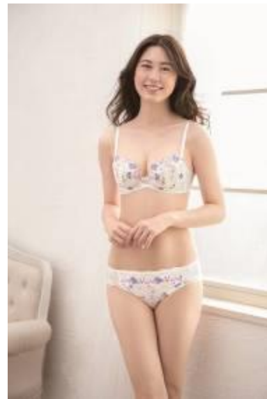
重力に負けない『バストケア Bra』 KB-2404 (カラー: IV)