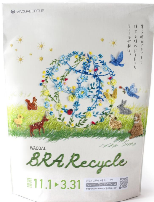
「ブラ・リサイクルバッグ」

（ワコール ブラ・リサイクル キャンペーンサイト http://www.wacoal.jp/braeco/ ）