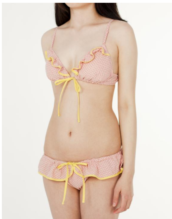
『てぬぐインナー』

全国の「ウンナナクール」44店舗、「ウンナナクール・ランチ」5店舗、「ウンナナクール ウーマン」2店舗および、ワコールウェブストア、Zozotownで7月16日より順次販売します。