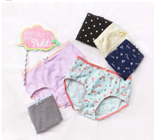
『non!PK（ノンピーケー）』 品番：RJ3800/RJ3801