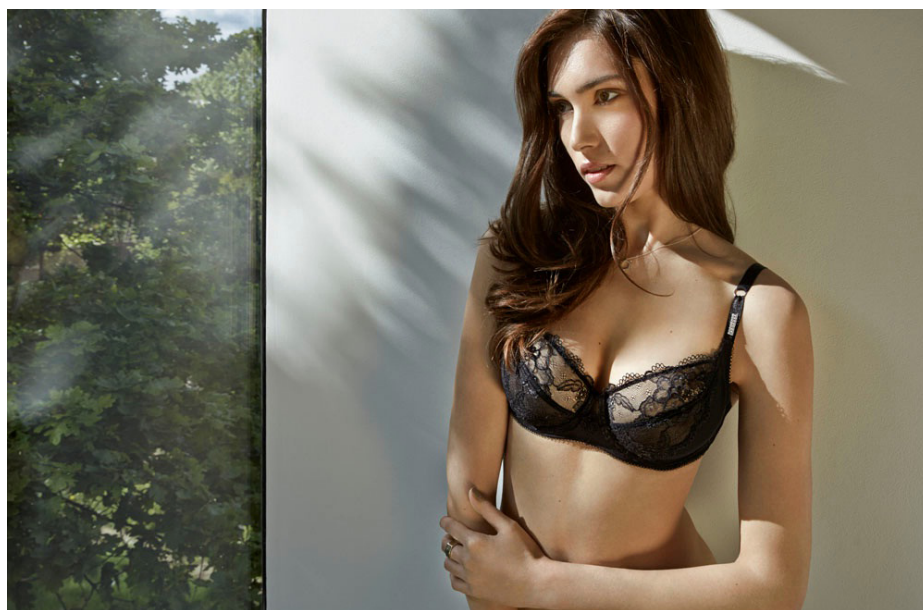
代表グループ『Marquise（マーキス）』

新たなラインの拡充により、「ワコール」ブランドは、毎日使えるベーシックラインから下着の悩みを解決してくれるスタイリッシュなグループまで、幅広いラインナップで展開していきます。