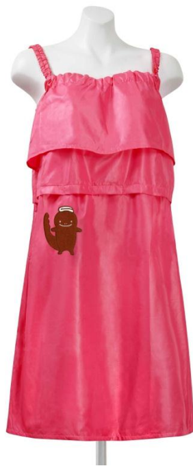
画像「はんざきちゃん湯あみ着」品番：RNV700、カラー：ピンク

この「はんざきちゃん湯あみ着」は、男女混浴の露天風呂で、女性が男性の視線を気にせずに入浴が楽しめるよう、外見はかわいく、体のラインをカバーする機能やデザインを考案。撥水性や速乾性に優れた素材を使用し、着用時の不快感を軽減します。また、湯原温泉オリジナル仕様で、国の特別天然記念物「オオサンショウウオ（呼称：ハンザキ）」を可愛くアレンジしたアップリケを刺繍しています。カラーはグリーンとピンクの2色で、グリーンは真庭市の豊かな自然と森をイメージし、ピンクはおかみさんの会のイメージカラーにしています。