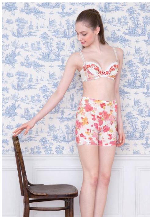
『着席美人』 GRC・390（カラー：アイボリー）

※調査概要 2013年10月 ワコール インターネット調べ 10代～70代女性 計1,586人