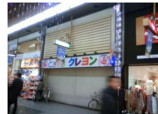
↑ オープン前の様子