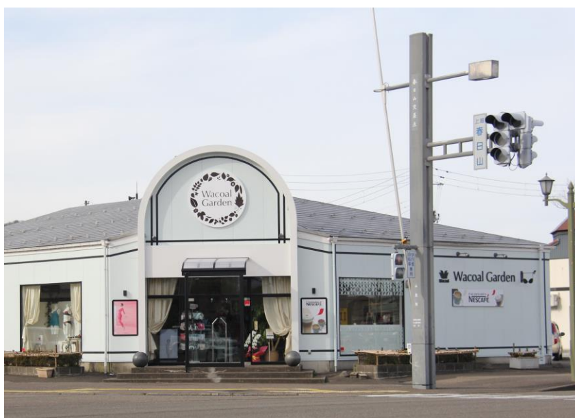
「ワコールガーデン上越店」

地方小売店とワコールの協業業態である「ワコールガーデン」は、地域とのつながりを大切にしてきた地方小売店の強みを生かしつつ、それぞれの商環境の変化に対応し、顧客との接点を維持・拡大するビジネスモデルとして、2019年までに計約20店舗の展開を目指します。