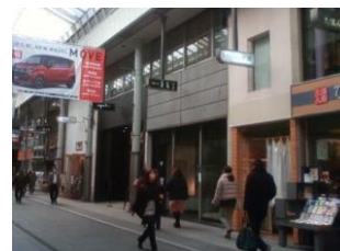
↑ オープン前の様子 ←店舗外観