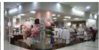
↑ オープン前の様子