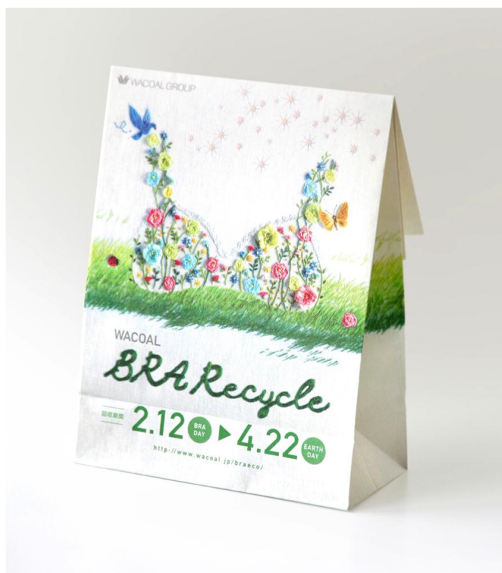
「メイド・フロム・ブラジャー」の「2015 ブラ・リサイクルバッグ」

(Wacoal×YouTuber特設サイト: http://www.wacoal.jp/youtuber/ )